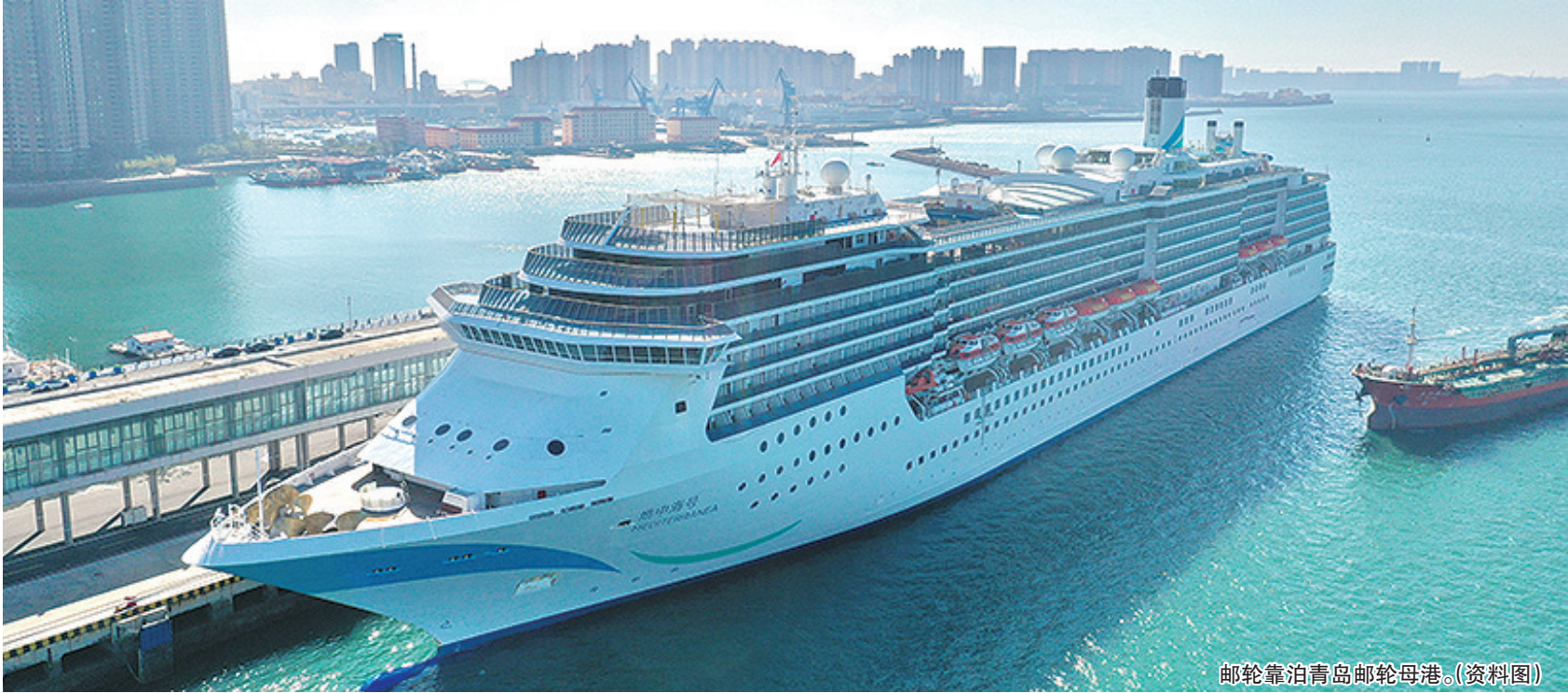
邮轮靠泊青岛邮轮母港。(资料图)

本报2月2日讯 来青岛旅游,除了城市City walk,你还可以选择乘坐邮轮,来一场说走就走的海上City walk。2月2日,青岛邮轮母港2024年2-4月邮轮航线正式发布,共有6条航线供市民游客选择。 此次发布的航线包括青岛(访问港)、厦门-日本宫古-青岛、青岛-韩国济州-青岛、青岛-韩国济州-日本福冈-青岛、青岛-韩国济州-日本长崎-青岛、青岛-日本宫古-厦门。据悉,爱达邮轮旗下主力船型“地中海”号在去年11-12月开启青岛首航的基础上,将于3月24日从厦门出发载客来青,2000多名游客将游览山东、青岛特色景点,感受“好客山东”“时尚青