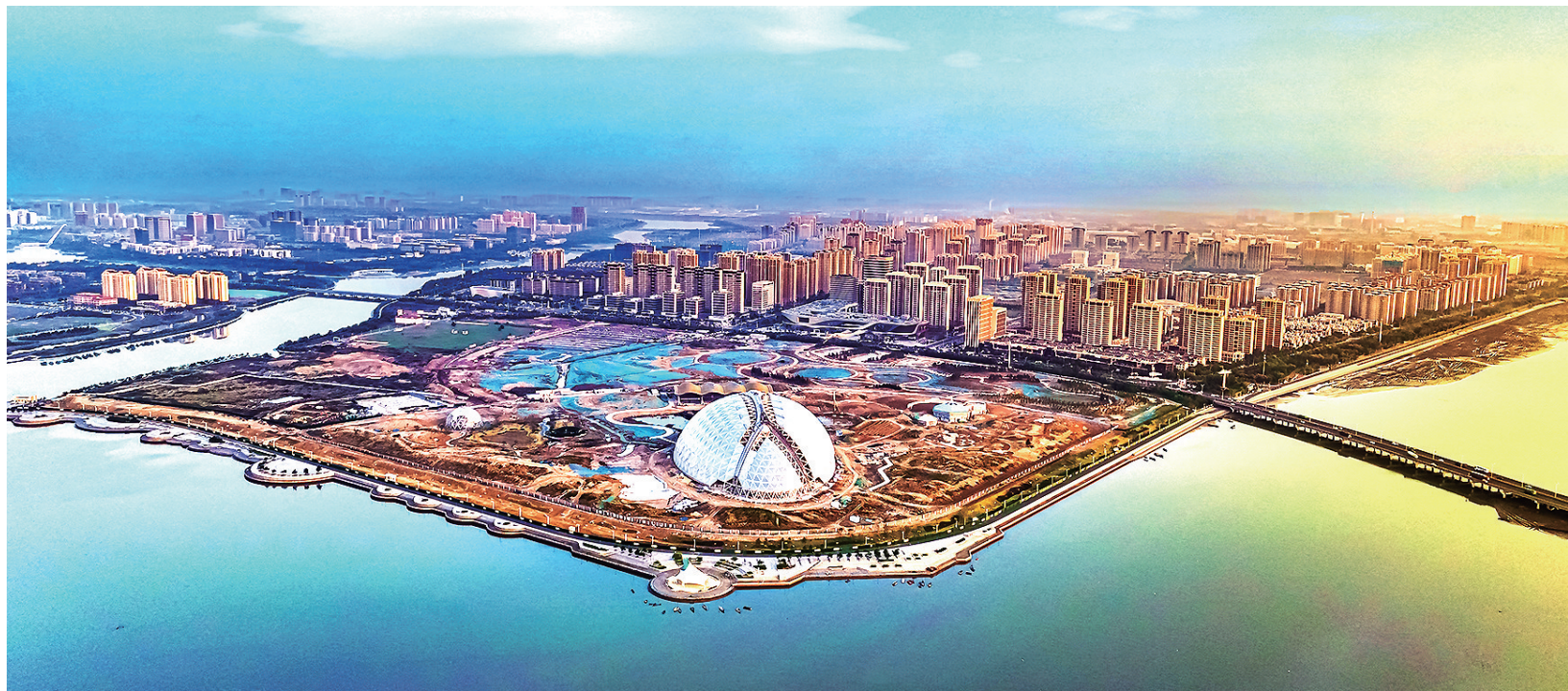
东方伊甸园实景图。