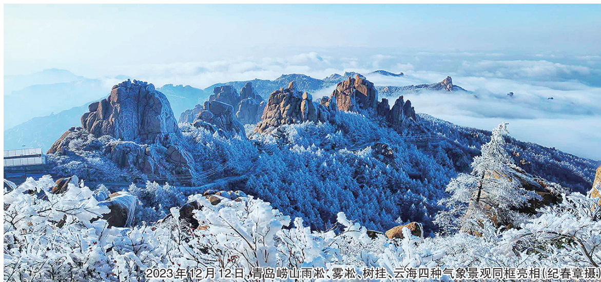
2023年12月12日，青岛崂山雨凇、雾凇、树挂、云海四种气象景观同框亮相