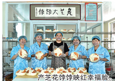
产芝花饽饽映红幸福脸。