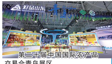
第三十届中国国际农产品交易会青島展区。