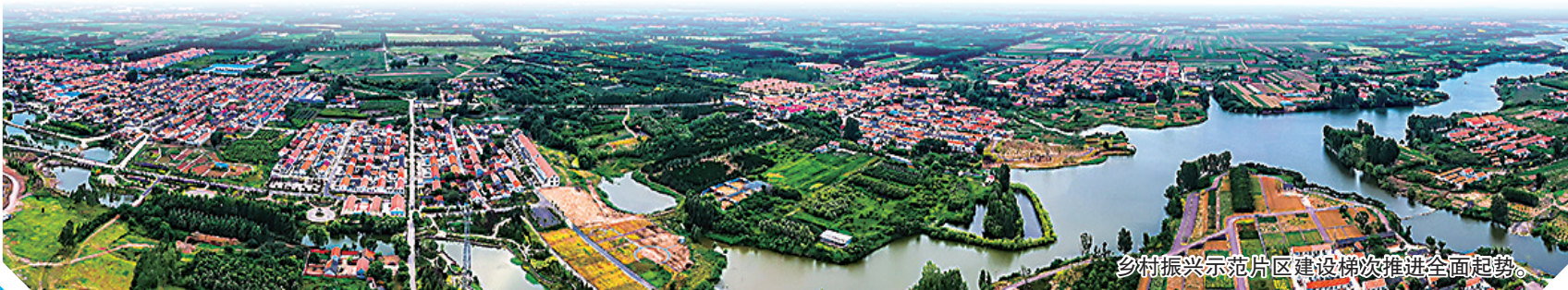
乡村振兴示范片区建设梯次推进全面起势。

观海新闻/青島晚报/掌上青島 记者 高静文 通讯员 冯志