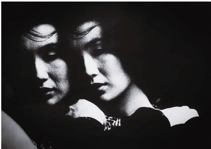
叶锦添作品《三个女人的故事》。

他曾凭借电影《卧虎藏龙》获得奥斯卡金像奖“最佳艺术指导”；自 1986 年参与了第一部电影《英雄本色》起，他曾担任多部电影的美术指导与服装设计，包括 2023 年火爆刷屏的《封神第一部：朝歌风云》。他是广为人知的叶锦添。然而，少有人知道，叶锦添还是一位出色的摄影师。毕业于香港理工大学实用摄影高级摄影专业的他，将自己多年来对摄影所怀有的抱负、对事物的理解方法和对时间的看法，进行阶段性总结，精选出各时期代表摄影作品 109 幅，并配以精炼亲切的回忆性文字，在 2024 年新年伊始，出版了首部自传性摄影随笔集《凝望：我的摄影与人生》。