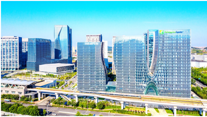
青岛市人工智能产业园。