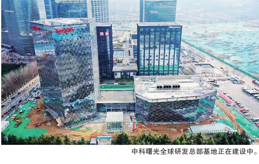
中科曙光全球研发总部基地正在建设中。

空中要效益、以产出论英雄”，着力推动“工业上楼”，年内盘活、收回闲置或低效工业用地300亩，促进产业用地集约高效发展。聚焦“旅游品质提升三年攻坚行动”，推动大河东文旅小镇、崂山文化艺术中心等项目开工建设，若七文化艺术综合体、银丰华美达酒店等项目竣工投用，打造山海特色的世界旅游度假目的地。聚焦国家健康旅游示范基地打造，全力推进生态健康融合发展，推动华芒生物总部一期等项目开工建设，新华锦小蓬莱国际康复医院等项目竣工投用，实现海洋生物医药产业园集聚发展。