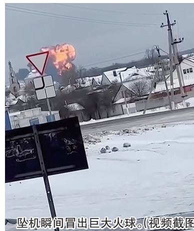
坠机瞬间冒出巨大火球。(视频截图)