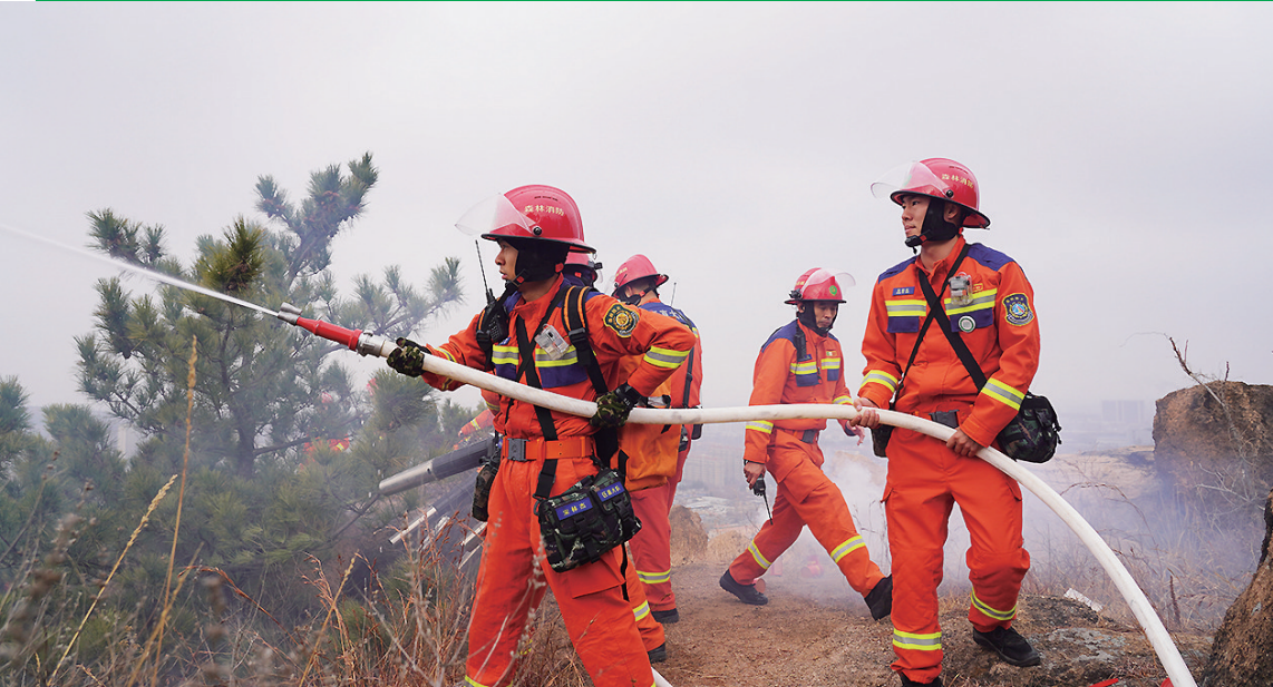
森林消防专业队伍进行火情早期处置。

本报1月14日讯 为进一步检验我市重点林区森林火情早期处置流程，磨合多区域联动响应机制，提升火情处置能力，14日，青岛市园林和林业局在城阳区组织举行重点林区森林火情早期处置拉动演练，市森防指领导，市园林和林业局、市应急管理局，各区市森林防火主管部门负责人参加了观摩。