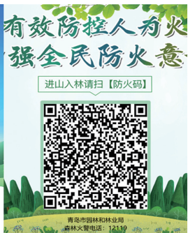
防火码助力进山人员及时扫码登记。