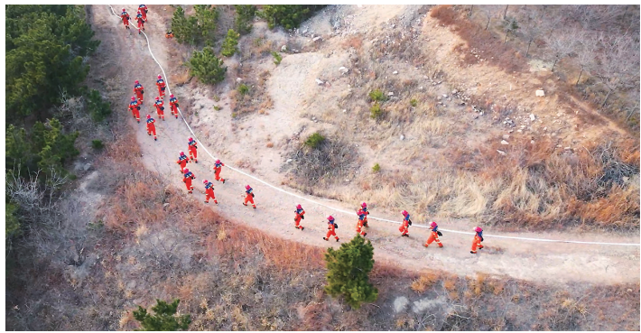
此次拉练增强了各部门、应急队伍之间相互衔接和协同作战能力。

（观海新闻/青岛晚报/掌上青岛 记者 高静文）