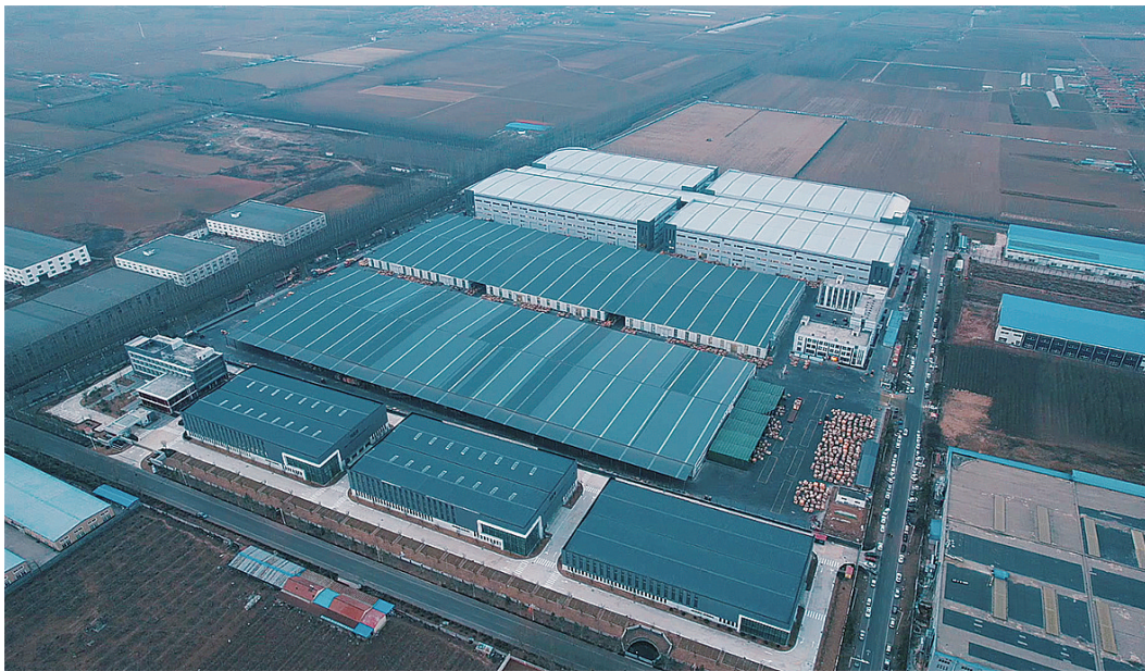
低效片区再现新活力。

随着城市更新项目的逐步深入,胶州市铺集镇在不断纵深推进中总结经验、探索道路,立足自身优势资源,将激活重点低效片区作为城市更新、变革村民风貌的重要推手,一手抓智慧家居产业,一手强农业技术发展,不断建设完善产业链条,以点带面,为城镇经济发展插上腾飞新翅膀。