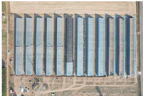
航拍标准化温室生产大棚。