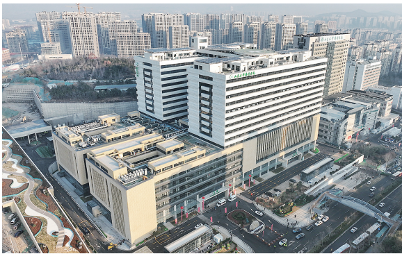
◀航拍山东大学齐鲁医院(青岛)二期。

在磁共振的候诊大厅,放射科主任姜庆军向记者介绍,“医院拥有全球首款国内自主研发的5.0T全身磁共振成像系统。该设备在2020年获国家科技进步一等奖,我院为国内总装机第6台,青岛地区唯一一台最高场强的磁共振设备。其最大优势是分辨率高,达到亚毫米成像,图像质量明显优于3T磁共振,血管成像能显示更丰富的小血管,脑组织成像类似解剖图谱。通俗地说就是使用该设备