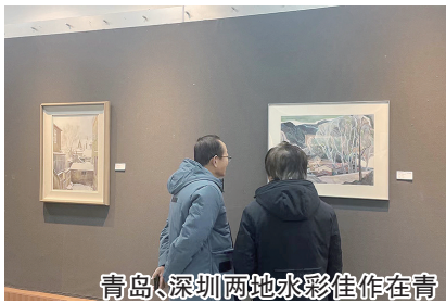
青岛·深圳两地水彩佳作在青“遇见·山海”。

“遇见”,是文化的传播,“山海”是地域的相融。12月23日,“遇见·山海——青岛·深圳水彩名家作品交流展”在青岛出版艺术馆开幕。该展览由青岛市市南区文学艺术界联合会、深圳市罗湖区文学艺术界联合会、山东水彩画会、深圳市美术家协会水彩画艺术委员会主办。