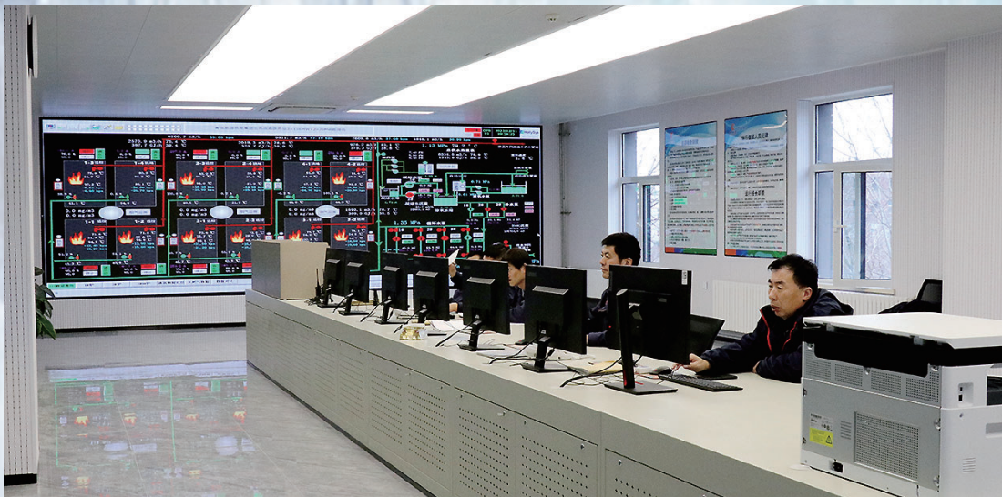
热企随时监控供热情况。