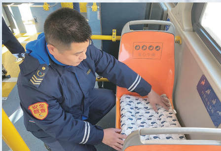
非空调公交线铺棉垫。

在寒潮天气持续侵袭下,岛城将迎来入冬以来最冷的一个周末。19日起,受新一股强冷空气影响,我市将再迎雨雪大风天气,气温也将再度走低,气象专家提醒市民注意做好防寒保暖措施。岛城供水、供热和公共交通等部门全力应对寒潮天气。