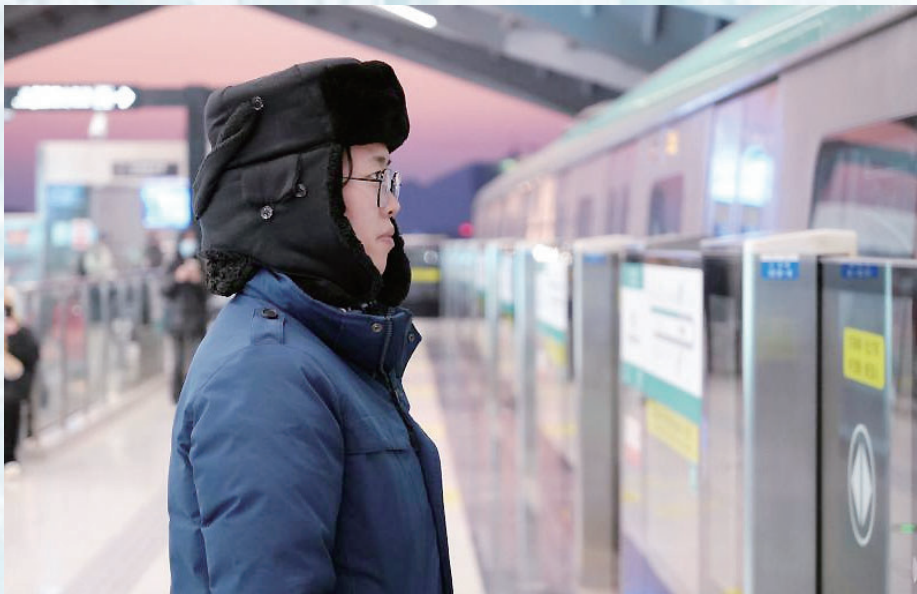
地铁多措并举保障市民出行。

步完善应对极寒天气保障措施,组织各供热站、换热站进行了拉网式安全大排查,为设备、管线穿上“保暖衣”,针对一些易出故障、使用频率较高的电气设备和机械设备,实施重点“关照”,及时处理了各种不稳定状况,确保关键时刻“顶得住”。应急抢修工作人员保持通信畅通24小时待命,车辆、物资等统筹调度,遇到问题能够及时反应、高效处置,确保关键时刻“顶得上”。