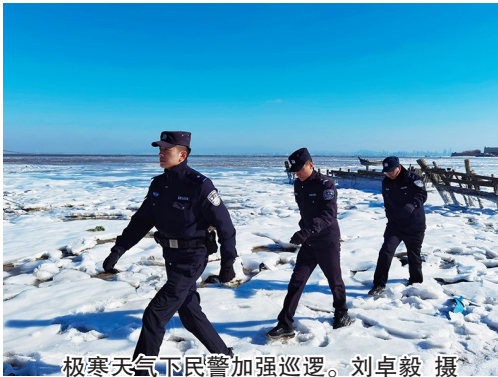
极寒天气下民警加强巡逻。