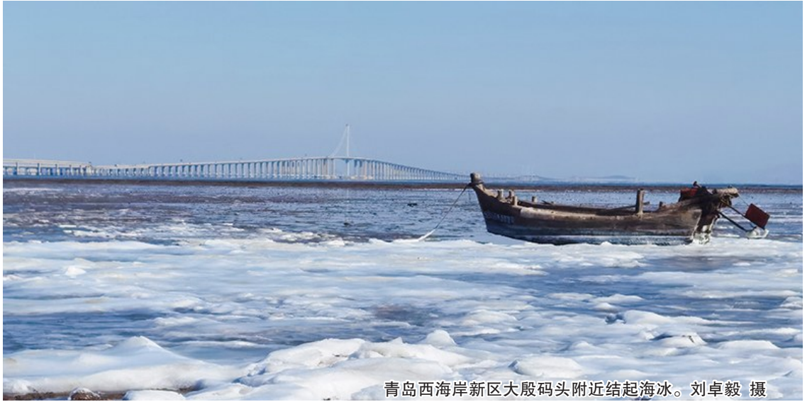
青岛西海岸新区大殷码头附近结起海冰。

12月16日开始,受寒潮大风天气影响,胶州湾西侧出现海冰。12月17日,记者跟随青岛市公安局海岸警察支队龙泉派出所民警巡逻,见证了他们救助遇险船舶的一幕。民警也向市民发出提醒:海冰虽壮观,只可远观。