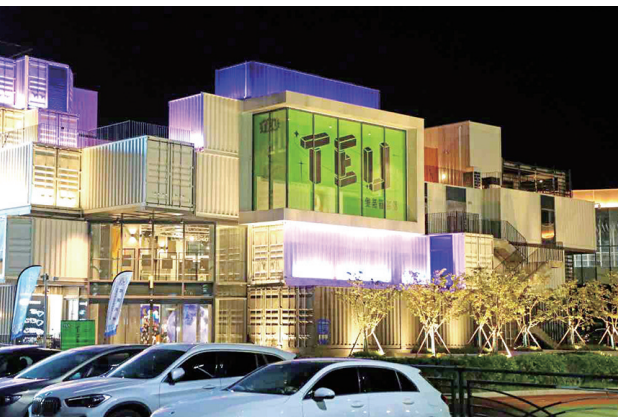
TEU集装箱部落点亮邮轮母港的夜晚。