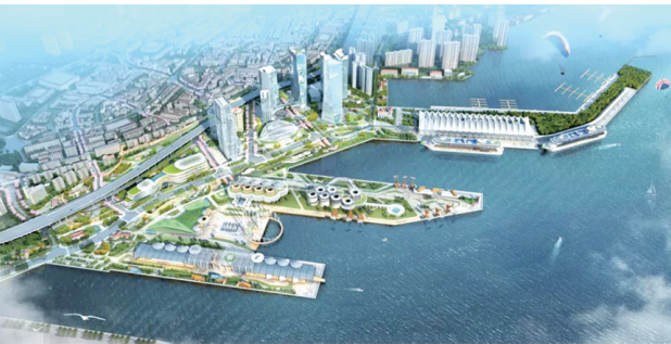
青岛国际邮轮港区规划效果图。