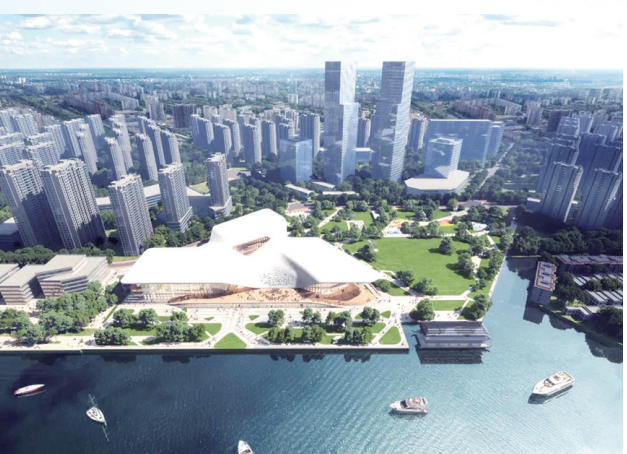
滨海活力湾文体中心日景鸟瞰图。