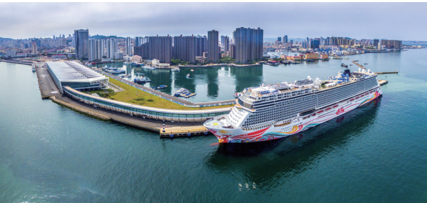
俯瞰青岛国际邮轮港区。(资料图)