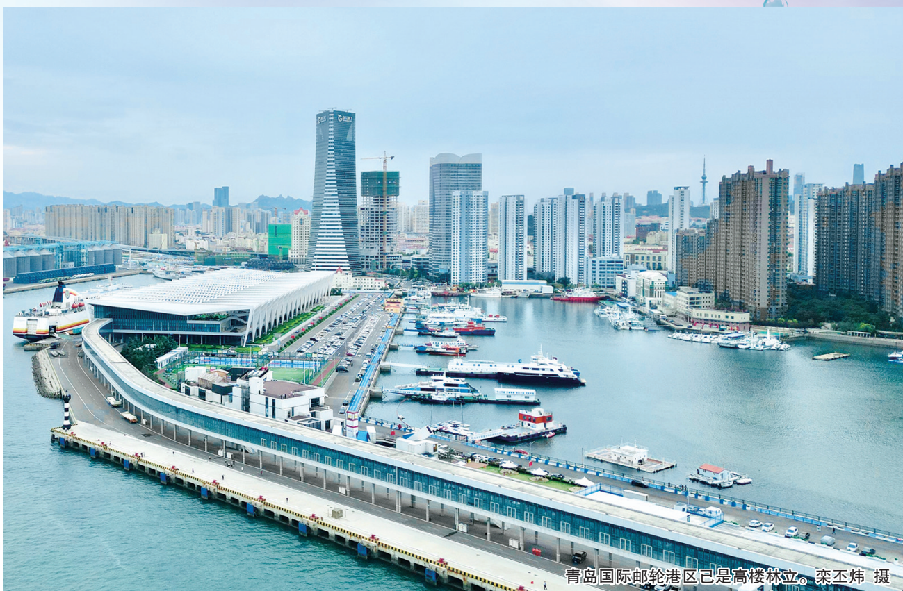
青岛国际邮轮港区已是高楼林立。