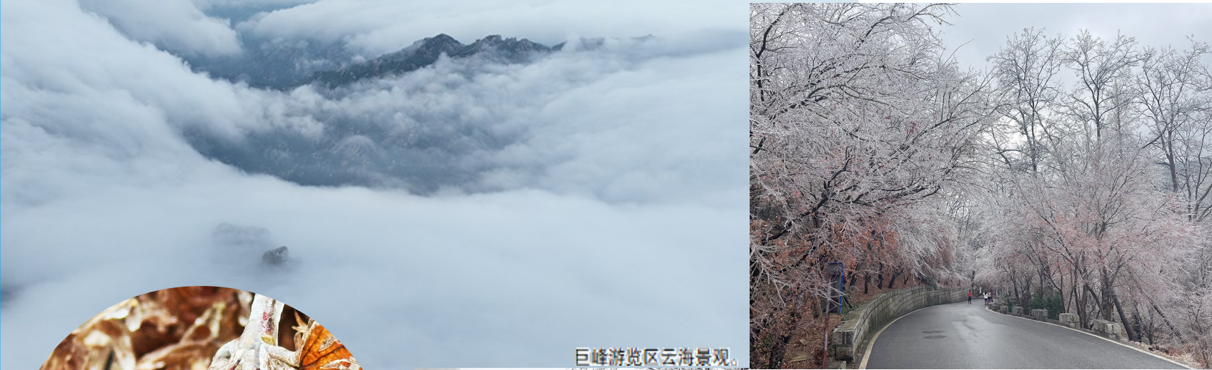
巨峰游览区云海景观。