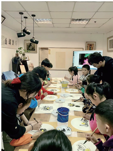
小朋友进入中国画的世界。