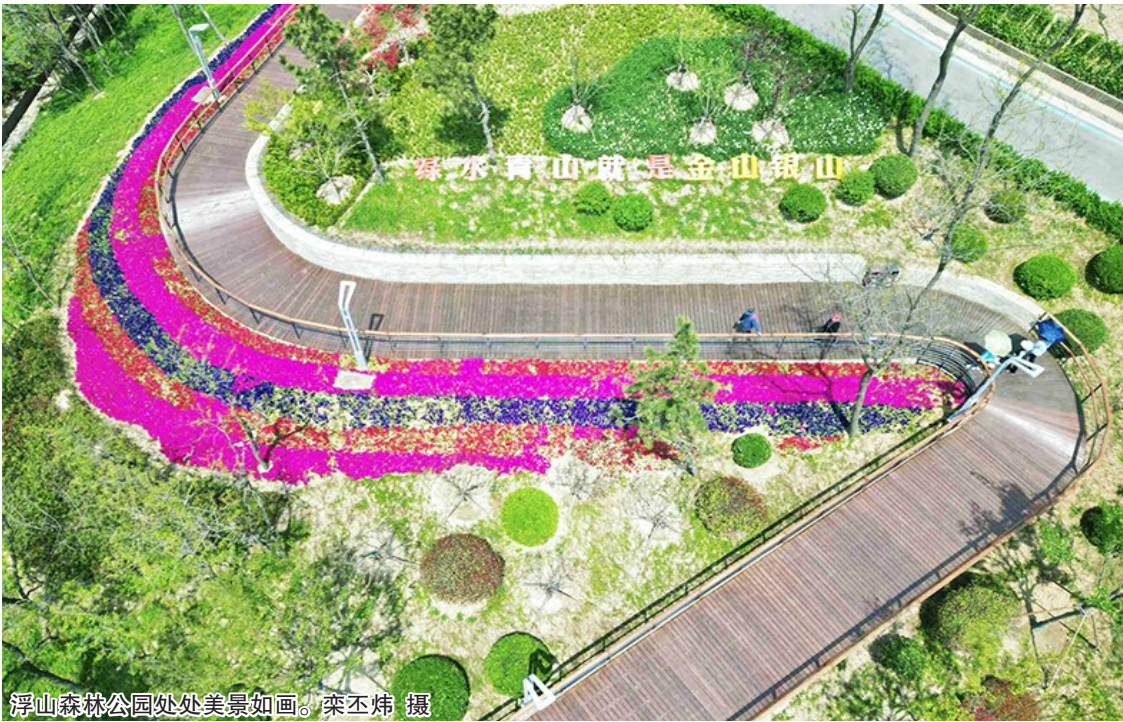
浮山森林公园处处美景如画。

徜徉于如今的浮山森林公园,以往较少爬山的市民、游客可能想不到,这里曾经是“眼中有美景,脚下