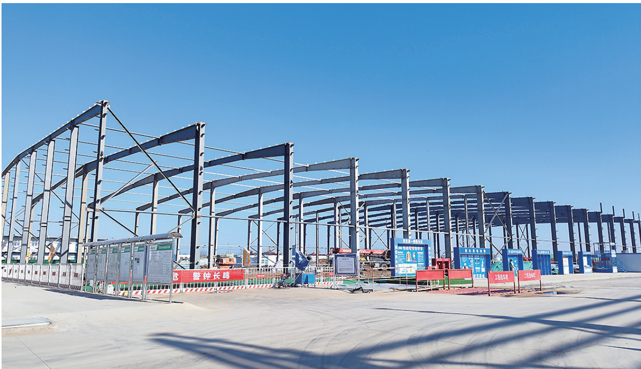
山东高速上合经贸产业园项目施工现场。

据介绍，胶北街道主动融入上合新区一体化发展大势，坚持“三个一”工作路径，全力推动上合国际枢纽港新城建设。在三季度胶州市经济运行及重点工作“摘星夺旗”考核中，总成绩位列第四，经济运行板块位列第二。一是突出一个核心，顶格推进上合国际枢纽港建设。充分放大“四港联动”独特优势，联动上合示范区新疆分园、枢纽港喀什港区，为深化“平台对平台、生态对生态”模式畅通通道。聚焦要素保障，冻结枢纽港片区2453亩土地，为产业导入释放物理空间，并历时12天完成A3地块167亩土地协议签订工作。二是抓牢一个主业，全力聚优培强临港产业。重点抓好山东港