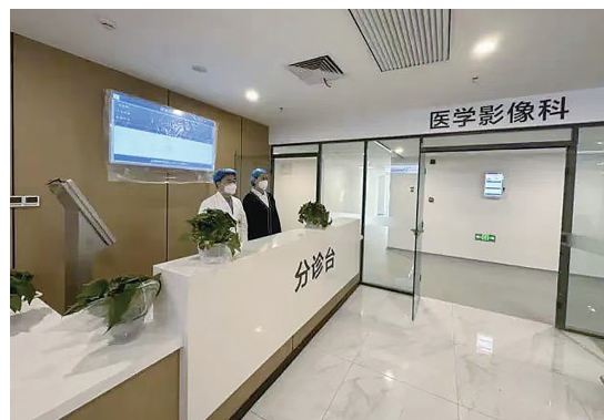
新大楼启用后的青岛市第六人民医院医学影像科。