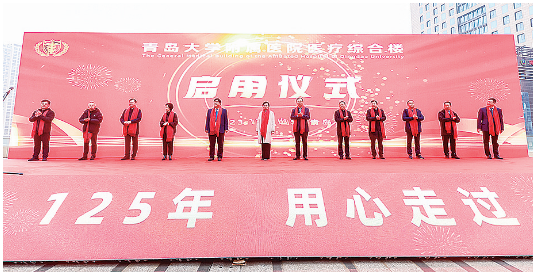
青岛大学附属医院医疗综合楼启用仪式。

近日,青岛大学附属医院医疗综合楼启用、青岛市人民医院集团成立,青岛卫生健康领域的“大事”不断。进入12月,即将启用的山大齐鲁医院(青岛)二期项目更是备受期待。放眼2023年全年,我市医疗卫生资源的软硬件携手提升,可以窥见未来医疗的模样,省心又舒心的看病就医新体验已到来。