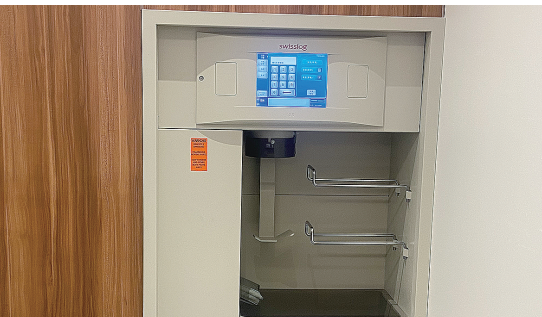
青岛大学附属医院医疗综合楼配备有气动传输系统。