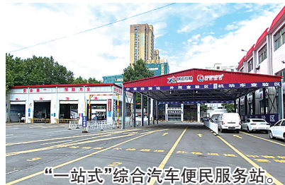
“一站式”综合汽车便民服务站。

管业务便民服务站,开通驾管业务窗口,办理驾驶证相关业务,此举是中青检测提升服务的又一重要举措。近年来,该公司积极拓展业务范围、提升服务质量,致力于打造集车辆年审、交易、保养、保险等于一体的“一站式”综合汽车服务商,院内可实现车辆年审、新车挂牌、二手车过户、车辆保养保险、车驾管业务,实现车管、驾管、年审“一站式”办理,按下优质服务“快捷键”。(观海新闻/青岛晚报/掌上青岛 记者 徐美中)