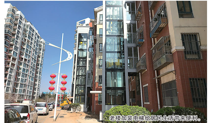
老楼加装电梯给居民生活带来便利。

我市于2016年12月5日印发《青岛市开展既有住宅加装电梯试点工作实施方案》，启动既有住宅加装电梯工作。截至2023年10月底，全市累计组织实施加装电梯3285部，已交付使用1802部。今年前十月，新增交付758部，全国排名第七。期间，市住房和城乡建设局坚持政策先行，会同相关部门陆续制定发布了《青岛市既有住宅加装电梯暂行办法》等政策文件，基本形成了涵盖总体要求、技术导则、办理流程、资金奖补等方面的政策体系。 为进一步发挥基层组织作用，夯实加装电梯组织实施职责，市住房和城乡建设局充分结合既有住宅加装电梯工作实际，坚持问题导向，会同相关部门制定了《关于进一步做好既有住宅加装电梯组织实施工作的通知》，作为我市既有住宅加装电梯政策体系的完善补充。