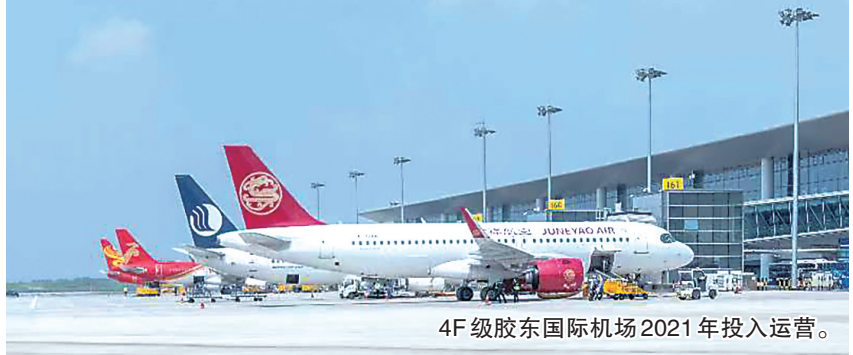
4F级胶东国际机场2021年投入运营。

青岛已初步建成以国际化空港（青岛胶东国际机场）、现代化海港（青岛港）为中心，以高速公路、高速铁路为骨干，与城市交通紧密衔接的综合交通运输体系，正按照交通强国等国家战略部署，加快建设国际性综合交通枢纽和交通强国山东示范区青岛先行区。 全市公路通车里程15458公里，其中高速公路892公里、位居副省级城市第3位，普通国省道2231公里、位居副省级城市第2位，一级公路占比42%，农村公路12335公里，行政村通沥青、水泥路率达到100%，基本实现村内通户道路硬化“户户通”。青岛境内现有铁路12条、运营里程666公里，形成“一弧六射”高快速铁路网和由青岛站、青岛北站、红岛站、青岛西站构成的“三主一辅”客运枢纽布局。4F级胶东国际机场2021年投入运营，可满足年旅客吞吐量3500万人次、货邮吞吐量50万吨、飞机起降29.8万架次保障需求。今年前三季度旅客、货邮吞