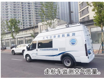
走航车监测空气质量。