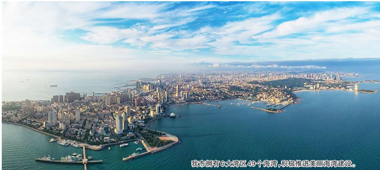
我市拥有6大湾区49个海湾,积极推进美丽海湾建设。

我市全力抓好全国土壤污染防治先行区试点工作,在全国率先实施污染土壤转运联单制,为土壤管理再上“安全链”。严格建设用地准入管理,今年完成170个建设用地土壤污染风险管控和修复有关报告评审,重点建设用地安全利用率保持100%,确保市民住得安心。加快无废城市建设,构建“1+11+N”工作推进机制,已完成海尔废旧家电拆解再循环平台等重点建设项目14个,多措并举推动固体废物源头减量和资源化利用。我市编制《美丽青岛建设规划纲要(2022—2035年)》,年底前将印发实施。今年李沧区、即墨区成功创建国家生态文明建设示范区,目前全市70%的区市成功创建国家生态文明建设示范区和“两山”基地,省级生态文明建设示范区和“两山”基地10处。