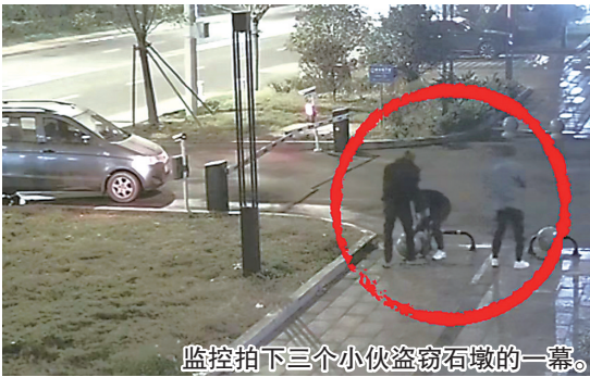
监控拍下三个小伙盗窃石墩的一幕。