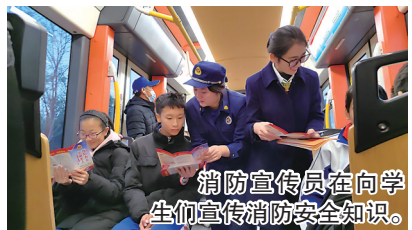
消防宣传员在向学生们宣传消防安全知识。

本报11月17日讯 为全力落实消防宣传月期间安全教育工作，进一步提高广大学生乘客消防安全意识和自救互救能力，11月15日，青岛市城阳区消防救援大队联合青岛城运控股集团轨道巴士公司志愿者在“锦绣前程——勤学专列”有轨电车车厢开展消防安全知识宣讲。