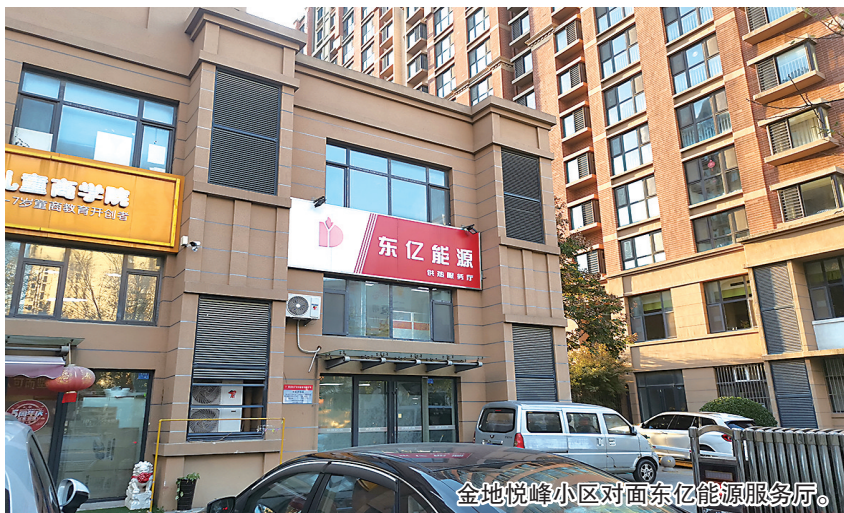
金地悦峰小区对面东亿能源服务站。