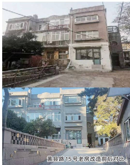
黄县路15号老房改造前后对比。