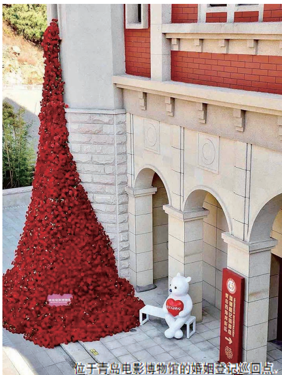
位于青岛电影博物馆的婚姻登记巡回点。