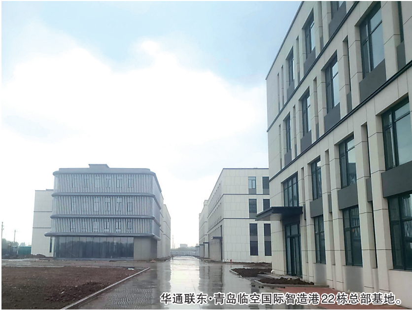
华通联东·青岛临空国际智造港 22 栋总部基地。

2023 年是青岛胶东临空经济示范区垂直崛起的关键之年,一批具有“航空”含量、“临空”特色的重大产业项目纷纷抢滩临空区,在胶东国际机场“大海星”牵引下,现代化上合空港新城正葳蕤生长。下一步,将树牢“全域上合、全域临空”理念,扩大项目招商半径,充分利用联东 U 谷大数据招商平台,全面分析联东全国入园企业,并结合临空区的流量和交通优势,精准吸引目标行业内的优质企业来胶发展。(观海新闻/青岛晚报/掌上青岛 记者 马丙政)