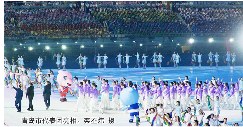
青岛市代表团亮相。

这一夜,我们张开怀抱,迎接一触即发的青春盛宴。11月5日晚,第一届全国学生(青年)运动会在南宁的广西体育中心举行开幕式。至开幕当日,青岛代表团已经取得21金18银15铜的好成绩,目前在金牌榜上暂列第三位。青岛代表团团长、副市长赵胜村出席开幕式。