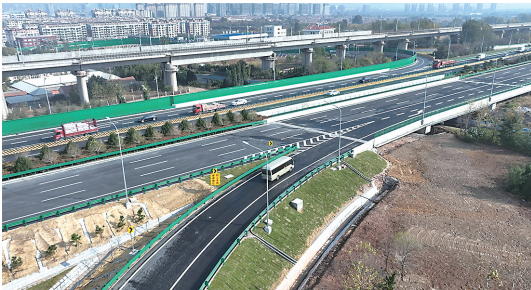
青兰高速公路双埠至河套段改扩建工程实现主线通车。

10月31日上午9时许,青兰高速公路双埠至河套段改扩建工程实现主线通车。通车后,将进一步加快综合交通运输体系构建,与青岛新机场高速、环湾大道实现高效衔接,大大提升周边路网疏解能级。