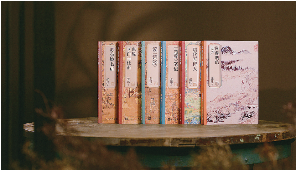
“张炜古诗学六书” 张炜 著 人民文学出版社 2023年8月出版

在张炜文学创作50周年之际,人民文学出版社推出了“张炜古诗学六书”,包括张炜在过去二十余年里钻研古诗词所写下的《读<诗经>》《<楚辞>笔记》《陶渊明的遗产》《也说李白与杜甫》《唐代五诗人》《苏东坡七讲》(即《斑斓志》),这也是六本书首次结集出版。跨越时空,一位中国当代作家与中国古典诗人们深度交流,“张炜古诗学六书”是张炜写给当代读者的古典诗学启蒙。