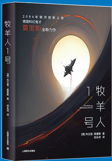
《牧羊人1号》 (德)布兰登·莫里斯 著 纪永滨 译 上海译文出版社 2023年9月出版