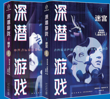
《深潜游戏》 (俄)谢尔盖·卢基扬年科 著 肖楚舟 译 新星出版社 2023年6月出版