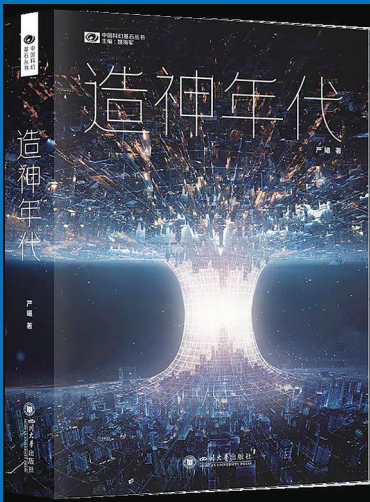
《造神年代》 严曦 著 四川大学出版社 2023年10月出版