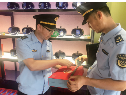
崂山区市场监管局专项整治茶叶过度包装问题。