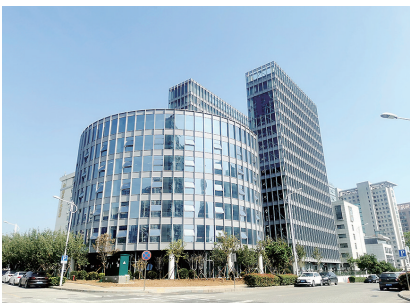
青岭路停车场垂直智慧立体停车。

入停车位,取车为逆过程。从入库、泊车、取车,到出库缴费,驾驶人可全程自主操作,不超过90秒的取车效率也处于国内同类项目最优行列。