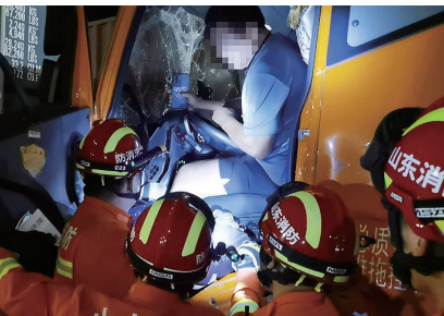
消防员在破拆施救。

本报9月12日讯 11日上午8时40分许,青岛市消防救援支队接到求救电话,东李新苑小区内,一名男孩的脚被卡在长椅里。李沧区李村消防救援站救援人员到场后发现,一名7个月左右的男孩左脚脚腕处被卡在长椅木条的缝隙中无法抽回。救援人员立即利用手动液压扩张钳扩开缝隙,大约5分钟后,男孩脱险。经过检查,男孩并未受伤。