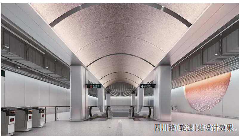
四川路(轮渡)站设计效果。

国际邮轮港站紧邻青岛国际邮轮母港,是专业邮轮码头,可停靠超大型邮轮,具有优越的自然禀赋、突出的区位优势、深厚的历史沉淀,整个空间以提取浪潮的曲线并结合艺术灯光交织成一首光与影的律动,形成流动的环境沉浸式体验空间。天花采用冲孔网板的形式,为空间增加透气感和朦胧