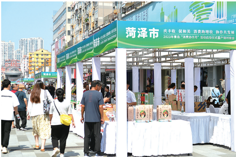
本次产销对接会将持续三天。

本报9月6日讯 6日上午，2023年青岛市“消费协作月”活动启动仪式暨产销对接会，在市区台东步行街拉开帷幕。采购签约、美食品鉴、直播带货，300余种协作帮扶和对口支援地的质优价平、绿色健康农特产品上架80余个展位，陇南祥宇油橄榄与青岛城运控股集团、渭源中小商贸流通企业服务中心与青岛青陇原农产品开发有限公司等12家企业，现场签订采购协议、协议金额5081万元。