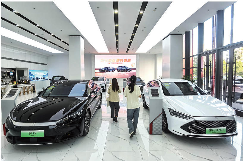
在李沧区开始经营的比亚迪4s店里，有众多车型。