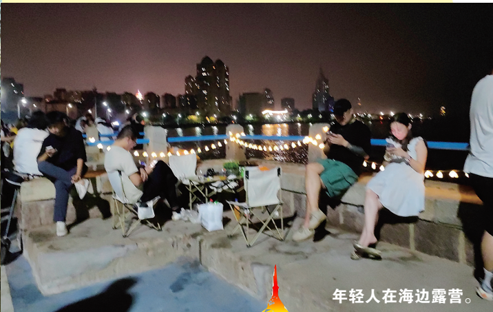
年轻人在海边露营。