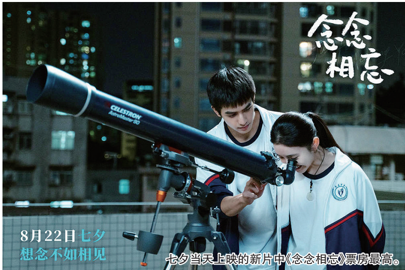
8月22日七夕 想念不如相见

今年的七夕档依然格外热闹。周冬雨、刘昊然主演的《燃冬》，刘浩存、宋威龙主演的《念念相忘》，以及《最遗憾是错过你》《爱犬奇缘》都在当天开映，其中《念念相忘》票房超过4000万元，成为当日爱的头条。大热影片《孤注一掷》仍旧在七夕当天票房霸榜，票房占比高达43%以上。