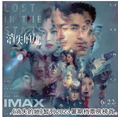
《消失的她》暂列2023暑期档票房榜首。