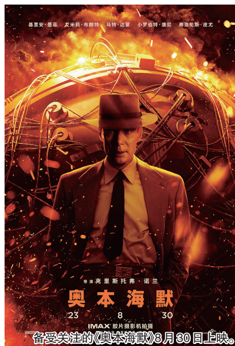
备受关注的《奥本海默》8月30日上映。