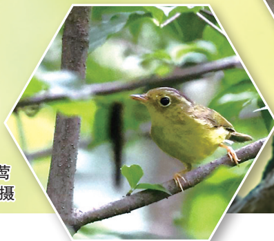
淡尾鹟莺