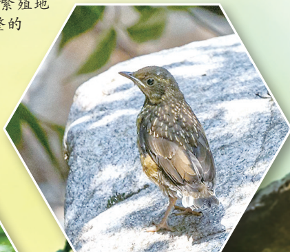
白腹鸫幼鸟