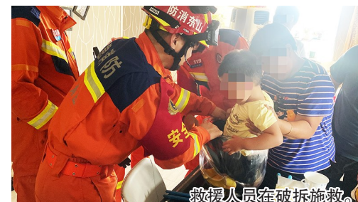
救援人员在破拆施救。

本报7月28日讯 7月23日下午3时许,青岛开发区消防救援大队接到求救电话,漓江东路一小区内,一名男童被卡在塑料桶内,急需救援。