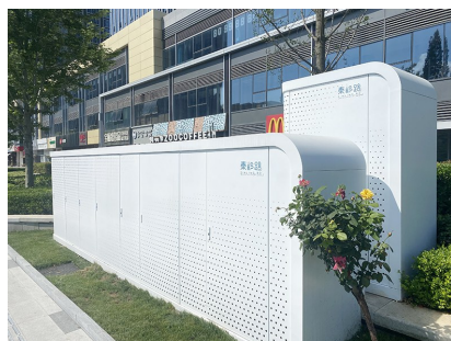
秦岭路老旧箱体整治后焕然一新。

本报7月28日讯 为建设具有青岛沿海特色与现代活力的高品质网红街区,2022年—2023年崂山区以“遇见秦岭路”为主题,对秦岭路实施了道路拓宽及视觉一体化提升改造工程,沿途推出了各类精美的景观小品和特色铺装,并为两侧的城市基础设施箱体“量身定制”了罩面设施,为道路沿线老旧箱体美化整治做出了新探索。