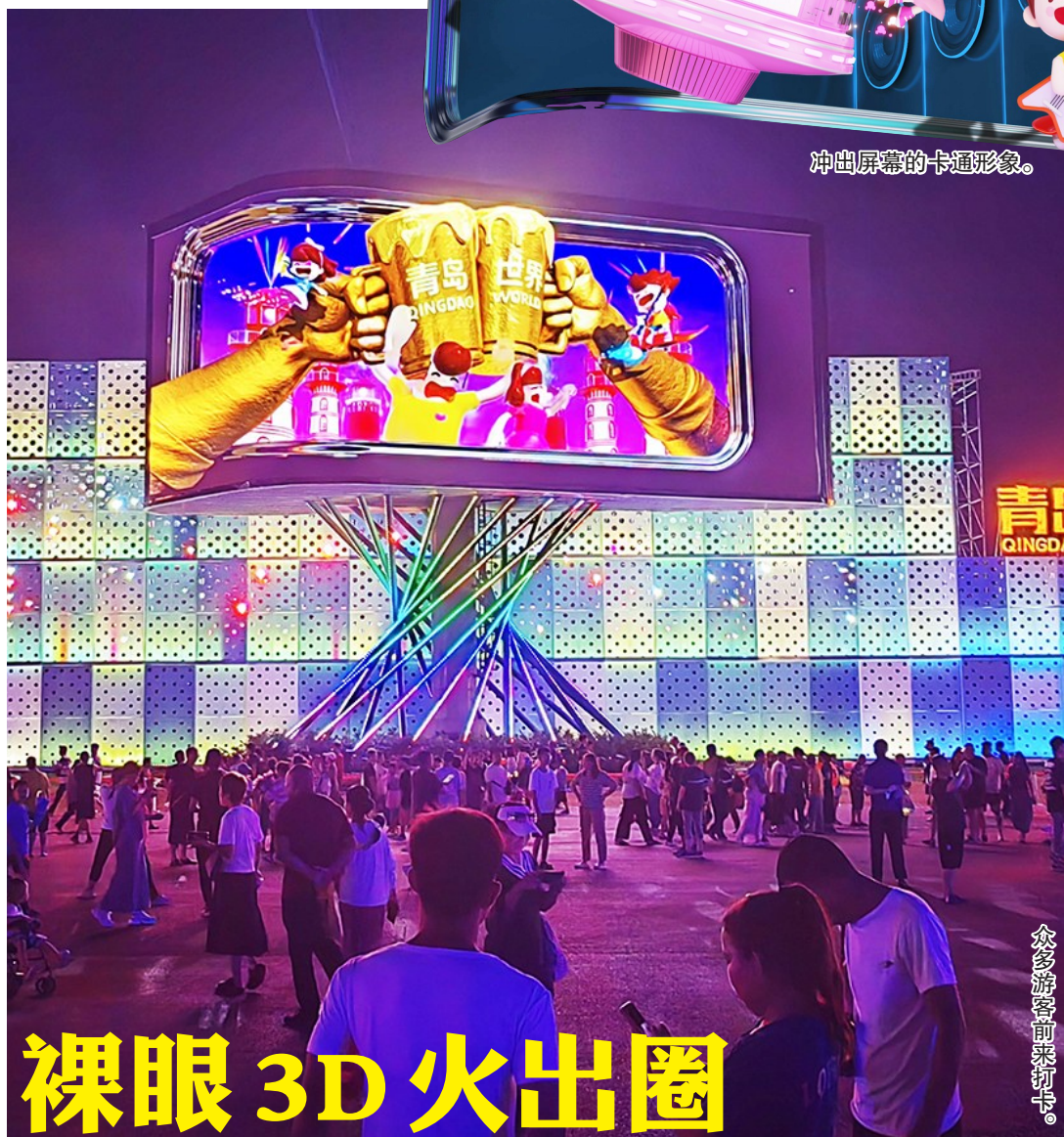
众多游客前来打卡。