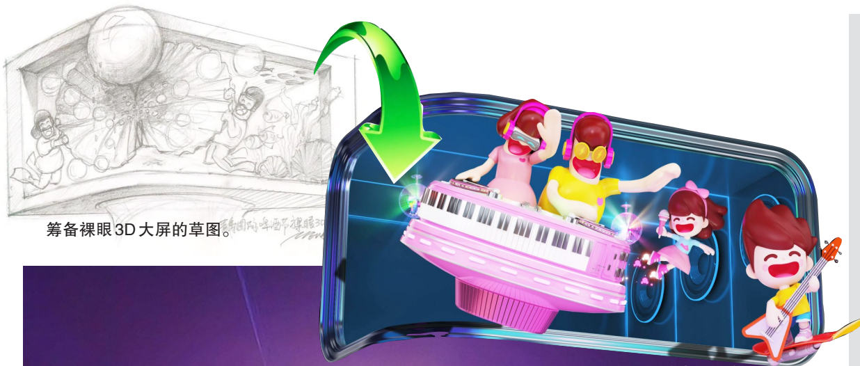
筹备裸眼3D大屏的草图。