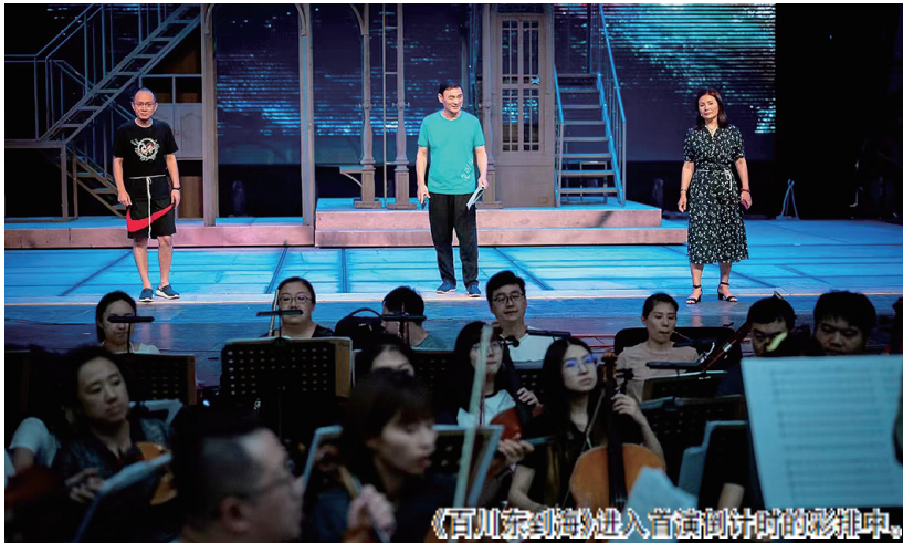
《百川東到海》進入音畫設計時的彩排中。

青島的原創呂劇，集中力量做足做大青島元素，展示青島呂劇藝術的傳承發展。青島演藝集團、青島市文學藝術界聯合會出品，青島市歌舞劇院創排的原創大型呂劇《百川東到海》，將於7月20日在青島市人民會堂首演。18日，該劇入駐會堂開始彩排合成，記者前往探班採訪，主創詳解了這部現代呂劇是如何守正創新，演繹青島抗戰故事的。