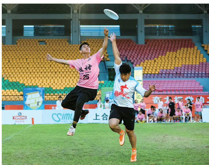
紧张激烈的极限飞盘赛。