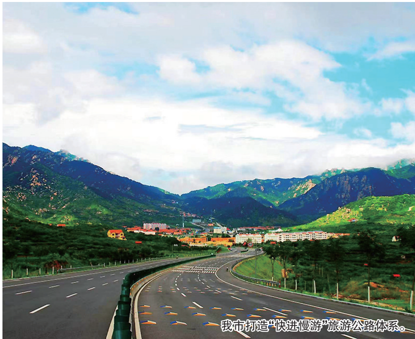
我市打造“快进慢游”旅游公路体系。

核心带。“一轴”即大小沽河生态公路,串联胶州、即墨、平度、莱西,打造生态休闲乡村旅游发展轴。“三环”即珠山—藏马山旅游大环路、大泽山—大青山旅游大环路和崂山山脉旅游大环路,依托崂山、珠山、大泽山三大生态源地,构建“三环”旅游公路网。环环之间,以高速公路为主要联系通道,形