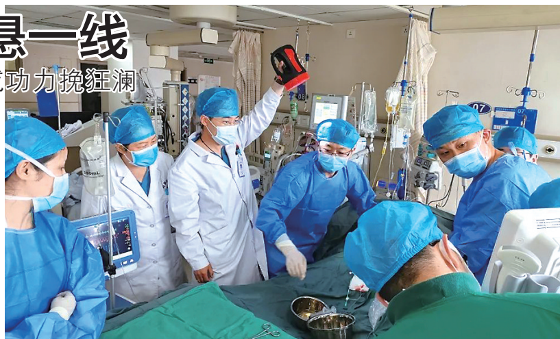
多学科团队抢救男子。