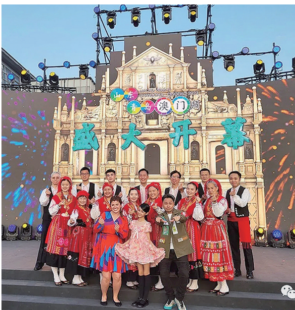
“澳门风情”引人入胜。

和投入度,参与者只要在“探秘寻宝地图”上的指定打卡点收集一定数量的印章,即可到“麦麦奇妙屋”兑换相应奖品,集齐一定数量的印章并透过社交平台(朋友圈、微博、抖音、小红书等)发布动态,再附带#探索澳秘之旅#、#山东·青岛澳门周#话题标签,更可参加抽奖活动。此外,参与适合大人小孩动动手的“跳房子趣味游戏”,可赢取精美的小礼品。