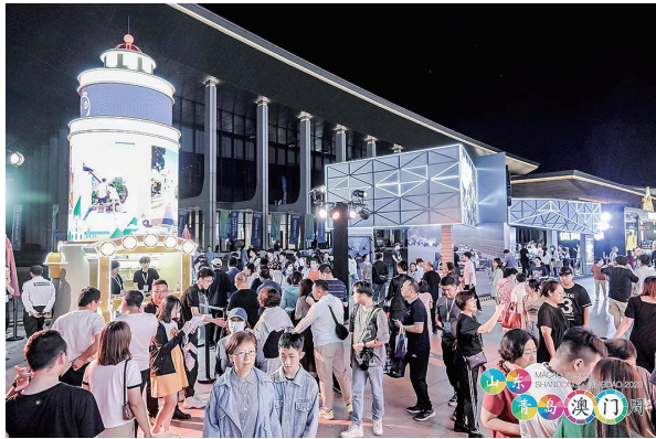
▲▼活动现场热闹非凡。