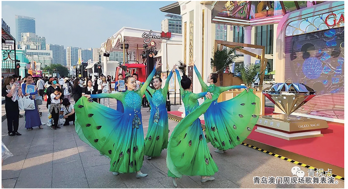
青岛澳门周现场歌舞表演。