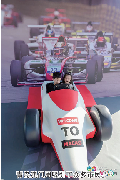
青岛澳门周吸引了众多市民。

“山东·青岛澳门周”6月9日开幕,重点项目大型路展8日至12日在青岛市南区奥帆中心广场举行。一连5天的路展向青岛市民展示澳门“旅游+”丰富内涵,期望借缤纷亮丽的展区和展位、互动体验、打卡游戏及舞台表演等不同元素,吸引当地市民到场感受澳门,启发游澳意愿,拓展客源。