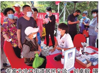
专家为沧口街道居民义诊。

本报6月6日讯 6月6日上午,在李沧区沧口街道社区卫生服务中心门前,中心承办的大型义诊活动,以及李沧区中医药强市“揭榜挂帅”项目暨二