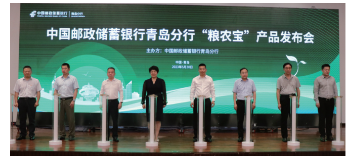
现场嘉宾启动发布仪式

部板块的协同资源，倾力打造更加契合农业新业态、农村新主体实际需求的产品服务模式，为青岛市农村经济及农业产业发展壮大提供更加精准有效的金融支持。