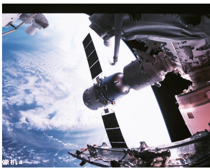
▲5月30日在北京航天飞行控制中心拍摄的神舟十六号载人飞船成功对接于空间站天和核心舱径向端口的画面。