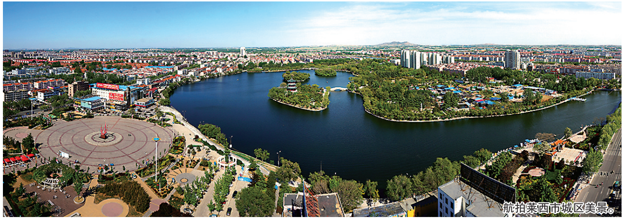
航拍莱西市城区美景。

合。对收到的损害营商环境问题线索建立专门台账，快查快办、限期办结；对疑难复杂、干扰多、阻力大、社会影响恶劣的，提级办理、挂牌督办、领导包案；对带有普遍性或反复发生的问题开展专项治理、集中整治。