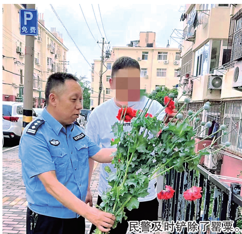
民警及时铲除了罂粟。

本报5月29日讯 5月29日，青岛市公安局市北分局民警在太清路和台湛路铲除了7株非法种植的罂粟。