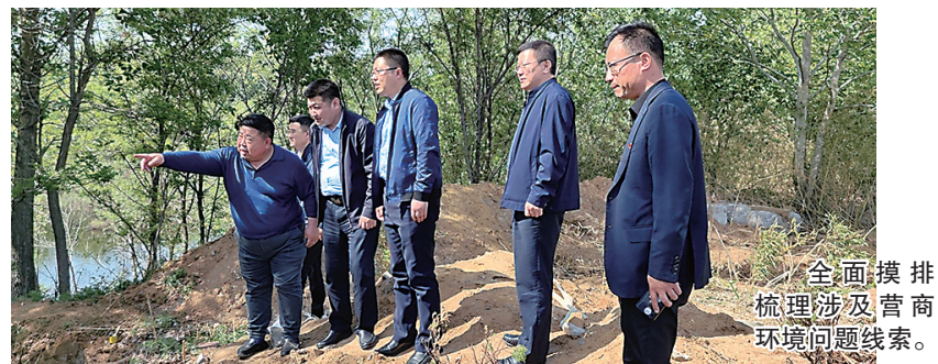
全面摸排梳理涉及营商环境问题线索。