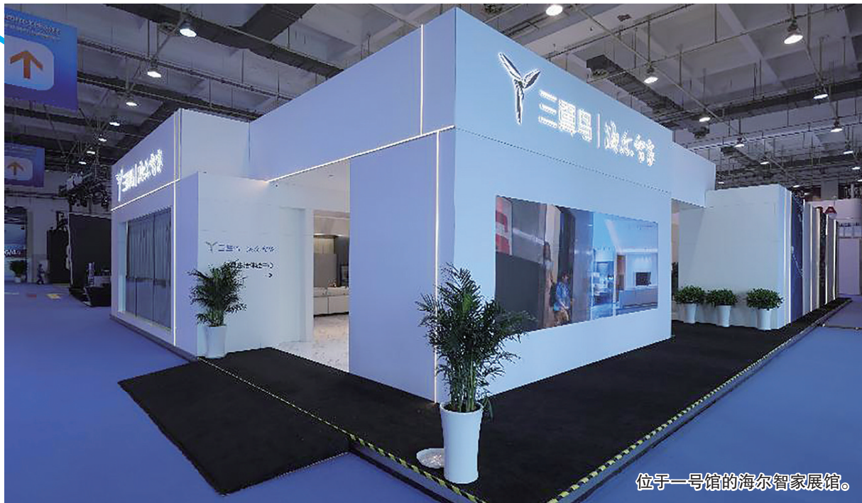
位于一号馆的海尔智家展馆。