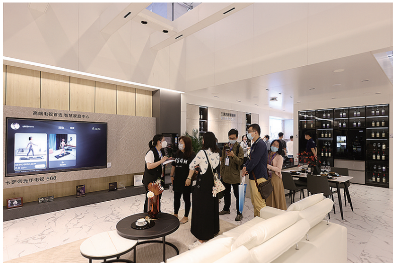
▲▼海尔三翼鸟智慧客厅。

爆款。在智慧阳台上,首创3D透视烘干科技的卡萨帝中子F2洗干集成机,带来私人高端护理的效果,轻松解决衣物烘不干、烘不透的难题;在智慧卧室,搭载独创“射流匀风”技术的星云空调,吹出自然软风,老人小孩睡觉也能放心开;在智慧厨房,针对大容量囤货和食材保鲜需求,卡萨帝冰箱搭载的原创MSA控氧保鲜科技以及健康分类收纳功能,能更好保鲜不同种类食材,鲜果蔬菜7天还很新鲜,肉类冷冻后营养流失少、口感依然很好。