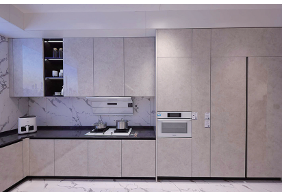
▲▼海尔三翼鸟智慧厨房。