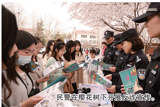
民警在樱花树下开展反诈宣传。

本报4月7日讯 为了让大学生在“沉浸式”赏花的同时也能学习反诈知识，4月3日上午，崂山