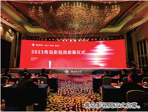
青岛影视周正式启幕。

本届影视周可谓活动丰富、亮点纷呈。设置了开、闭幕式以及“科影未来”、世界“电影之都”“金钥匙创投计划”“海平面”青年影人计划、“金海鸥”五大单元19项活动,以“影视+”的平台理念,面向市场、行业 and 大众,组织国内外影视成果展示、要素汇聚和交流互鉴,齐聚影视行业专家学者、资深人士和影视科技成果、顶级影片,为大家带来一场影视盛宴。其中,“科影未来”单元围绕“先进科学技术与电影高质量发展”这一主题,举办“科影未来”融合体验展、电影工业化主题交流、科影融合主题交流、2023山东省高新视频创新大赛启动仪式暨2022山东省高新视频创新大赛颁奖典礼等活动,就科学与影视融合、中国电影工业化发展展开深度探讨。世界“电影之都”单元举办联合国教科文组织电影之都主题活动,发布电影蓝皮书中英文版新书,发起世界“电影之都”城市《青岛倡议》;在青岛5大影院集中展出来自中国、英国、意大利、巴西、日本、德国、法国等国家的18部优秀影片,让市民感受世界电影文化魅力。“金钥匙”创投单元整体引入由六位知名导演发起的“金钥匙创投计划”活动,通过金钥匙课堂、“金钥匙创投计划”项目公开陈述、荣誉推荐大会为年轻影视创作者保驾护航。“海平面”青年影人计划单元“编剧新概念”系列活动由中国电影编剧研究院、中国电影家协会编剧教育工作委员会、中国夏衍电影学会、青岛海发文