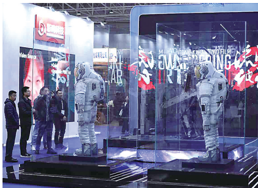
2023青岛影视周“科影未来”融合体验展现场。

青岛，作为第一个被联合国授予“电影之都”荣誉的中国城市，抓住影视产业转型升级的时代机遇，展开深度布局，以东方影都为核心，通过大力度招引培育，聚集超800家影视企业完善影视产业链体系，电影之都的发展壮大不断为青影师生提供平台和发展机遇；青影，从北京电影学院的唯一独立学院，到青岛第一个以城市命名的电影学院，十年发展，十年跨越，在传承北电雄厚师资力量时，又链接起东方影都广袤的产教融合资源，在“建设国内一流的产教一体影视人才教育与输出高地”的奋斗目标中路径愈加清晰、步子愈加铿锵有力，以“创制能力”蓄能级、谋发展，破圈出阵的新赛道轮廓日渐凸显，青影也将充分融入西海岸新区“影视之都”发展建设中，为影都持续提供优秀的电影人才和学术支持，从而实现双向赋能。